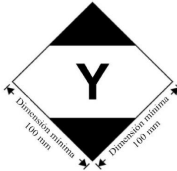
Figura No. 2

Marcado de los bultos que contienen cantidades limitadas de conformidad con las disposiciones del capítulo 4 de la parte 3 de las Instrucciones Técnicas para el Transporte sin Riesgos de Mercancías Peligrosas por Vía Aérea de la Organización de Aviación Civil Internacional